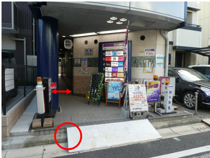
ビル北側の入口。EV 前通路幅約 67 cm。