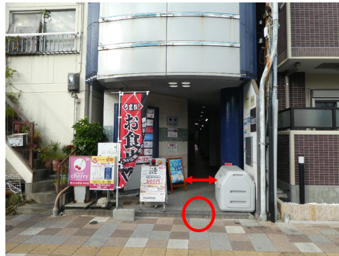
ビル南側の入口。段差約 9 cm。