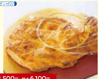
小 1,500円～特大 6,100円

●パイせんもんてん バイサク 店名通りサクツとしたおいしいパイの専門店。お祝いにも嬉しい鯛パイは、約40センチの特大から小まで4つのサイズをご用意。