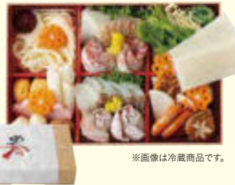
※画像は冷蔵商品です。

●あかしめでたいや おとりよせ大賞3年連続受賞殿堂入り商品。お母さんが席を立たなくていいがコンセプト。店頭では冷凍食品を購入できる。