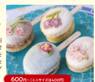
600円～(ミニサイズは400円)

●いろはのおと かわいいフォルムで非日常を演出してくれる棒付きマカロン。人工着色を使用しない自然の色味を利用したココロとカラダに優しいスイーツだ。