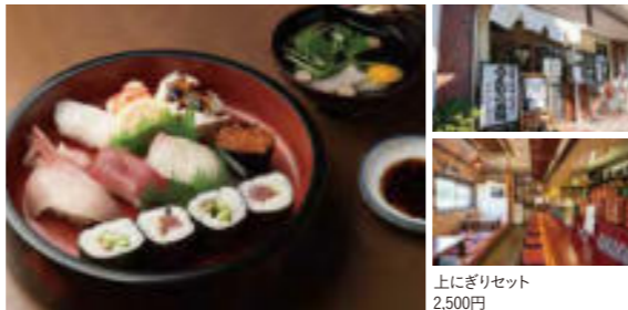
上にぎりセット 2,500円