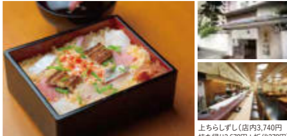
上ちらしずし(店内3,740円) 持ち帰り3,672円+折代378円)

TEL 078-911-3355 / TEL 078-911-2121 アクセス/JR・山陽電車「明石」駅から南東へ徒歩約5分