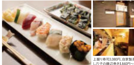
上握り寿司3,080円、自家製蒸し穴子の磯辺巻き1,840円～

TEL 078-911-8051 / TEL 078-911-8051 アクセス/JR・山陽電車「明石」駅から南へ徒歩約3分