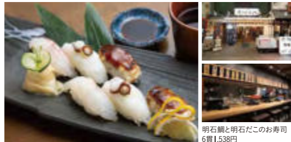
明石鯛と明石だこのお寿司 6貫1,538円