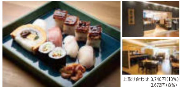
上取り合わせ 3,740円(10%) 3,672円(8%)