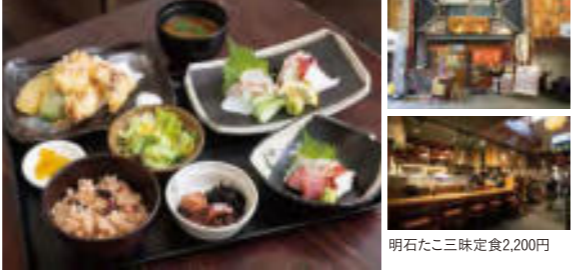
明石たこ三味定食2,200円