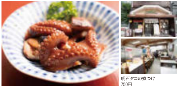
明石タコの煮つけ 750円

☎078-911-3579 アクセス/JR・山陽電車「明石」駅から南へ徒歩約8分