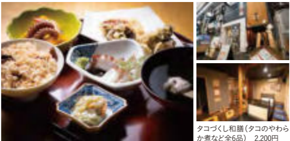
タコづくし和膳(タコのやわらか煮など全6品) 2,200円

☎078-918-3949 アクセス/JR・山陽電車「明石」駅より南へ徒歩約5分