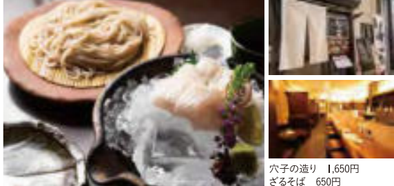
穴子の造り 1,650円 ざるそば 650円