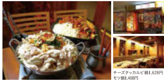
チーズタッカルビ鍋1,628円・モツ鍋1,408円