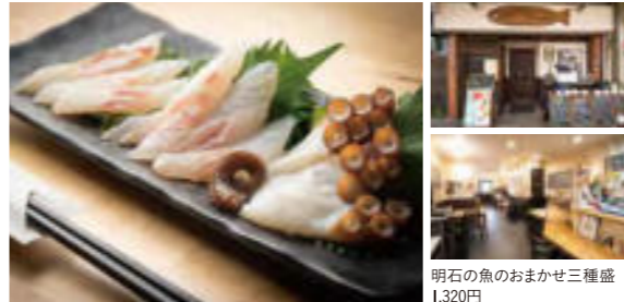
明石の魚のおまかせ三種盛 1,320円

☎078-945-6994 / 078-945-6994 アクセス/JR・山陽電車「明石」駅から南へ徒歩約5分