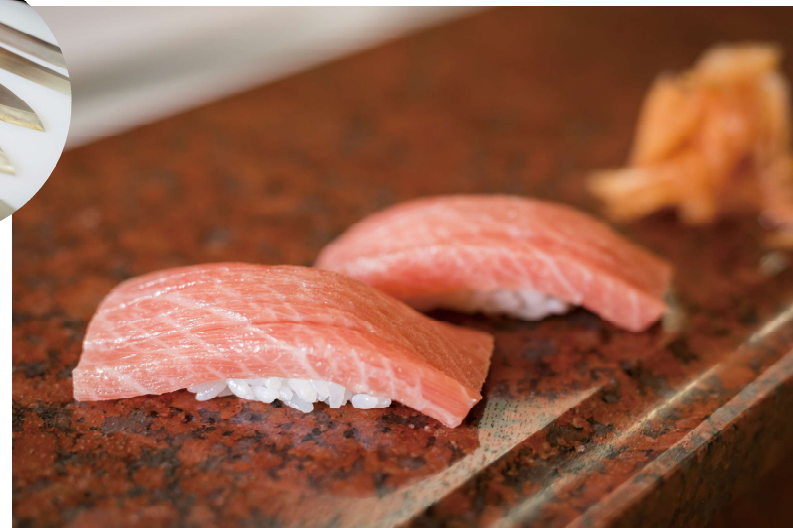
※取材協力/明石菊水 桜町本店