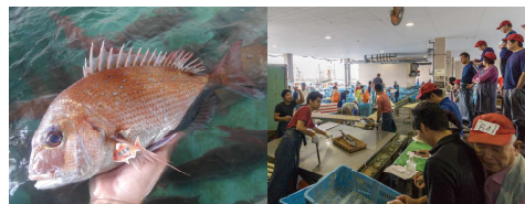
左)明石が全国に誇るブランド魚、明石鯛。鮮やかなピンク色が特徴 右)可能な限り活かして11時頃のセリに出る明石の魚は「昼鯛」と呼ばれる

日本全国、魚と鮭自慢の町は数あれども、やっぱり明石はモノが違う！はばかりことなくそう言い切れるのには、それなりのワケがあるワケで。