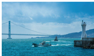
明石海峡大橋をバックに漁船が行き交う、明石の海の日常風景