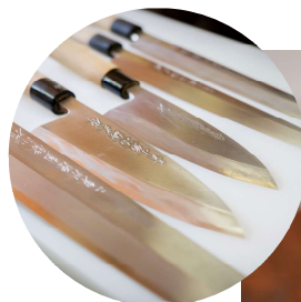
職人自ら丁寧に手入れを施した包丁の数々。道具も一見の価値あり